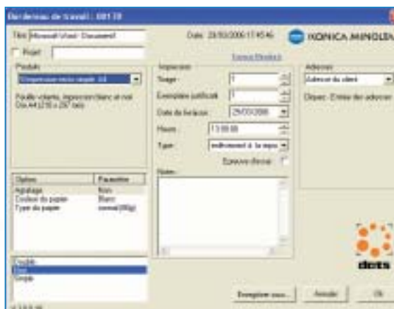
Interface de la solution DocMaster

Cela vous permet à tous moments de savoir qui demande l'édition du document, la quantité à imprimer ainsi que les finitions demandées par l'utilisateur. De plus, DocMaster enregistre automatiquement dans un fichier texte le travail qui a été imprimé avec le nombre de pages, le format papier. Ceci évite la saisie manuelle et les risques d'erreurs. Ce journal des tâches permet en fin de mois, par exemple, de savoir très simplement et avec précision la répartition de l'activité d'impression et ce, service par service au sein de l'entreprise.