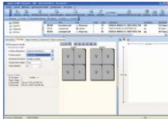
Interface de la solution DocMaster