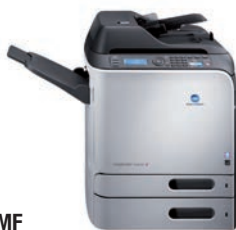
magicolor 4695MF avec bac papier inférieur en option