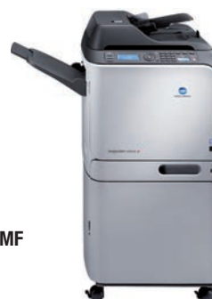
magicolor 4695MF avec meuble en option